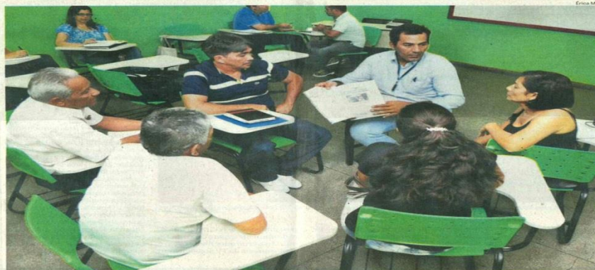
Representantes de organizações da sociedade civil se reuniram em Manaus com auditores da Secretaria de Controle Interno da Presidência da República

Em Manaus, as obras do Monumentillo e do BRT não vão mais ser concluídas antes da Copa de 2014. Mas tanto o Governo do Estado quanto a Prefeitura de Manaus, respectivamente, garantem