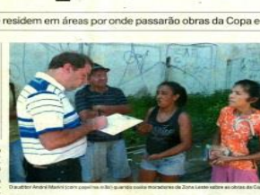
Um momento da visita de auditores da União e de representantes de comitês para ouvir as queixas da população em áreas de desapropriação de imóveis na área da Copa.

LOGO PERNAMBUCO A visita de representantes da União e de auditores da Presidência da República para ouvir as queixas da população em áreas de desapropriação de imóveis na área da Copa é baixa. Ela diz que os valores são muito baixos e que a população está sendo pressionada a aceitar uma baixa proposta para sair da casa onde vive há quinze anos, localizada na comunidade de Cosme e Damião, por causa das obras viárias da Cidade da Copa em Camaragibe e São Lourenço da Mata. Este é apenas um dos casos de reclamação relacionados ao processo de desapropriação de áreas para obras da Copa do Mundo de 2014. Ontem, a comunidade afetada recebeu a visita de